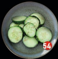
TSUKEMONO zure komkommer € 3,50