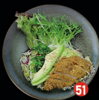
CHICKEN krokant kip, avocado en komkommer € 7,50