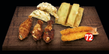
SNACKMIX - 12 ST. 5 st. mini loempia's, 2 st. gyoza, 3 st. chicken wings en 2 st. tempura € 9,50