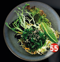
VEGETARISCH zeewier, avocado en komkommer € 6,00