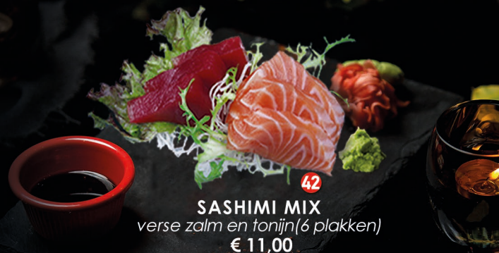
42 SASHIMI MIX verse zalm en tonijn (6 plakken) € 11,00