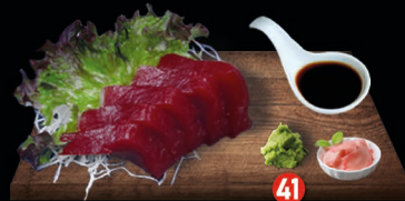
41 MAGURO SASHIMI verse tonijn (5 plakken) € 10,00