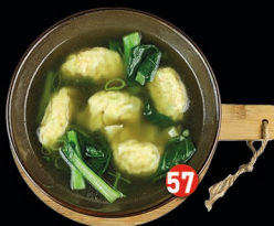
WAN TAN garnalen en kipfilet pasteitjes in kip bouillonsoep € 8,00