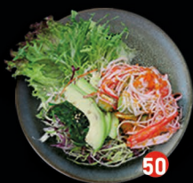
CALIFORNIA surimi, avocado, komkommer en masago € 6,50