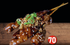
YAKITORI (kip, 4 stokjes) € 6,50