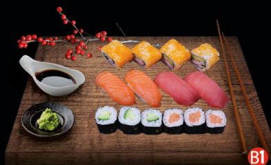
B1 TRENDY BOX - 14 st. california roll (4st.) komkommer maki (3st.) zalm maki (3st.) zalm (2st.) tonijn (2st.) € 15,50