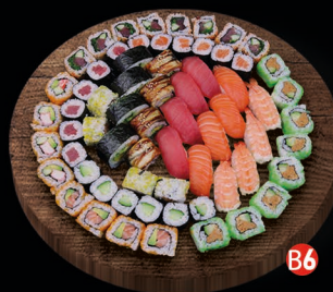
B6 FAMILY BOX - 66 st. california roll (8st.) sake avocado roll (8st.) spicy tuna roll (8st.) unagi roll (4st.), ebi fry roll (4st.) futo maki (4st.), komkommer maki (6st.) zalm maki (6st.), tonijn maki (6st.) zalm, tonijn en garnaal (4st.) € 69,95