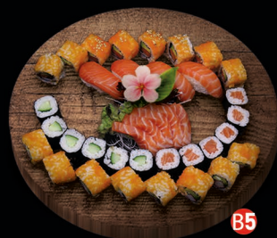
B5 SAKE BOX- 37 st. california roll (8st.) sake avocado roll (8st.) sake sashimi (5 plakken) sake nigiri (4st.) sake maki (6st.) kappa maki (6st.) € 35,50