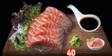
40 SAKE SASHIMI verse zalm (5 plakken) € 8,50