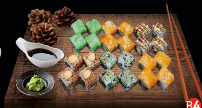
B4 SUSHI FOR TWO DELUXE - 24 st. california roll (4st.) sake avocado roll (4st.) spicy tuna roll (4st.) spicy maguro roll (4st.) yasai roll (4st.) tori roll (4st.) € 28,50