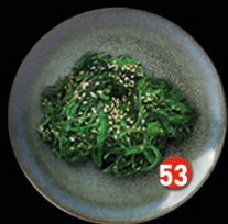
WAKAME ZEEWIER zonder sla en dressing € 4,50