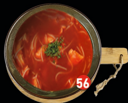
TOMATEN Chinese tomatensoep met kip € 5,00