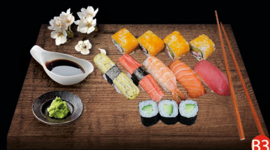
B3 BASIC BOX- 12 st. california roll (4st.) komkommer maki (3st.) zalm (1st.) tonijn (1st.) kani (1st.) garnaal (1st.) tamago (1st.) € 15,00