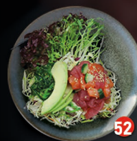
SASHIMI verse tonijn en zalm met avocado en komkommer € 9,00