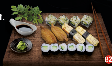
B2 VEGGIE BOX - 14 st. yasai roll (4st.) komkommer maki (3st.) avocado maki (3st.) tamago (2st.) inari (2st.) € 15,00