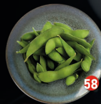
EDAMAME sojabonen € 5,00